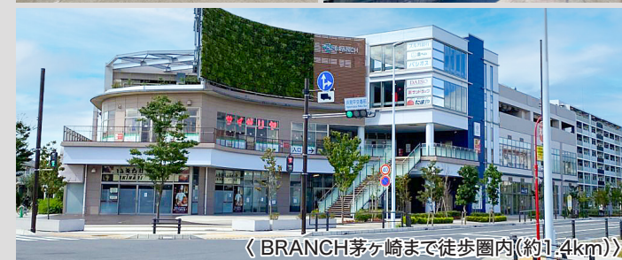
《BRANCH茅ヶ崎まで徒歩圏内(約1.4km)》