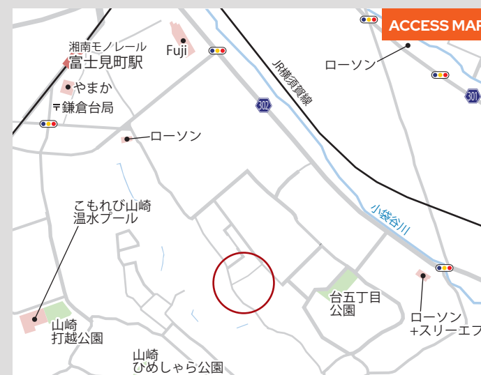
CAR NAVI INFO.